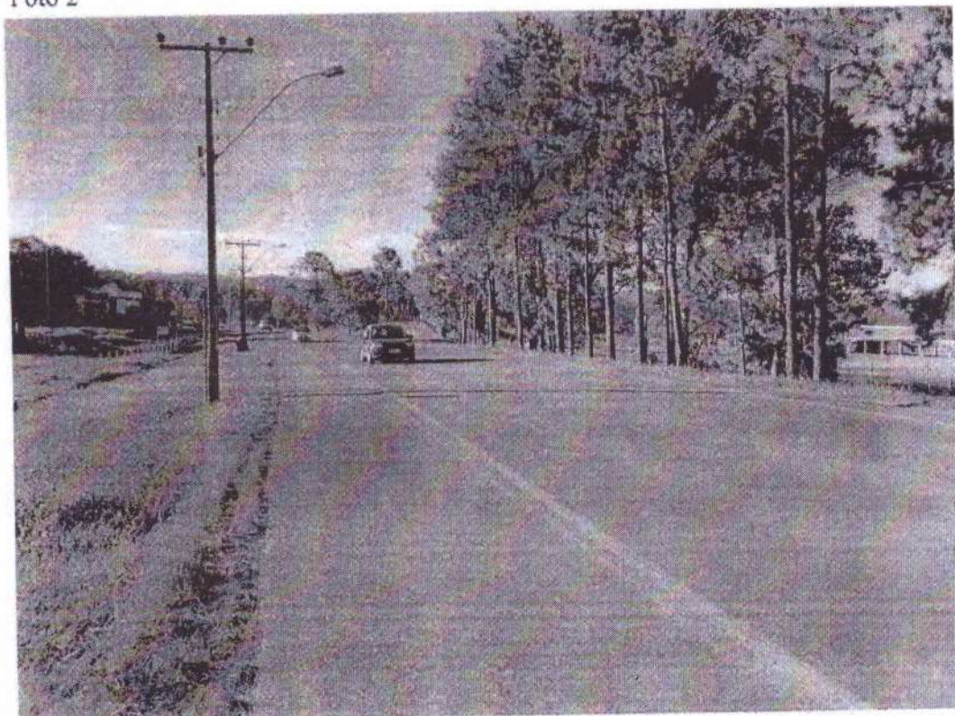
Rua Hercílio Fides Zimmermann, nº. 800