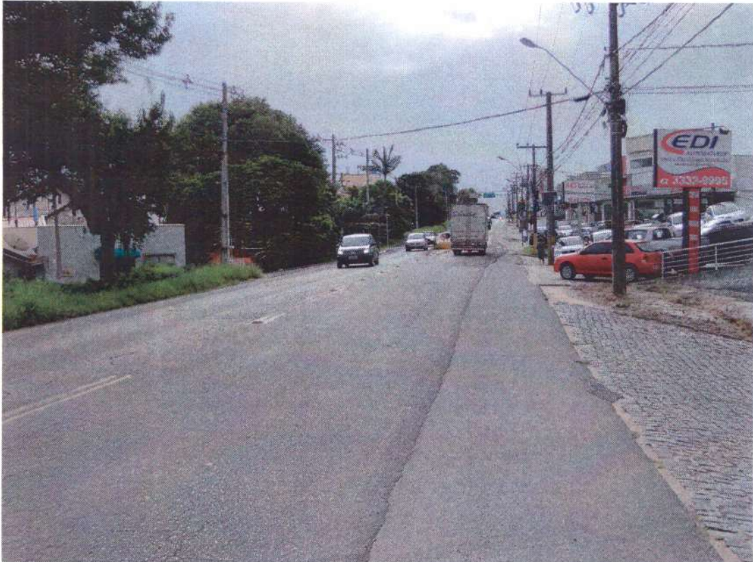
AV. Frei Godofredo, nº1081