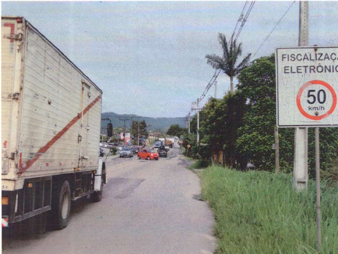
AV. Frei Godofredo, nº1080