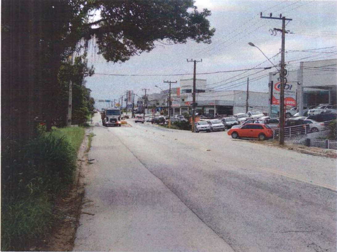
AV. Frei Godofredo, nº1081