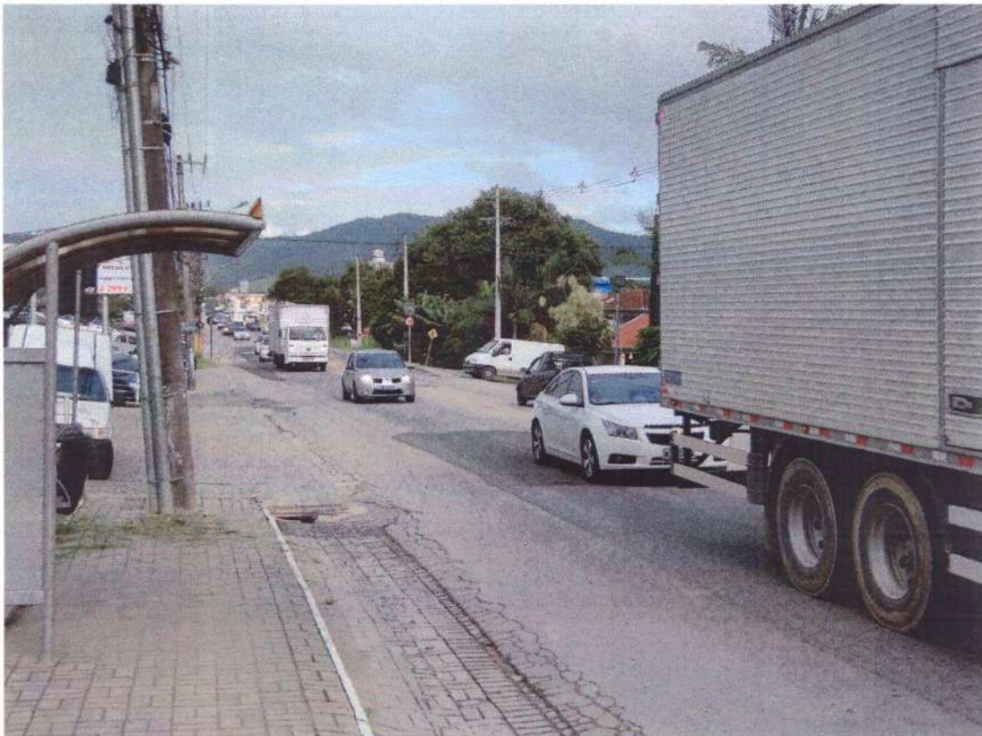
AV. Frei Godofredo, nº1080