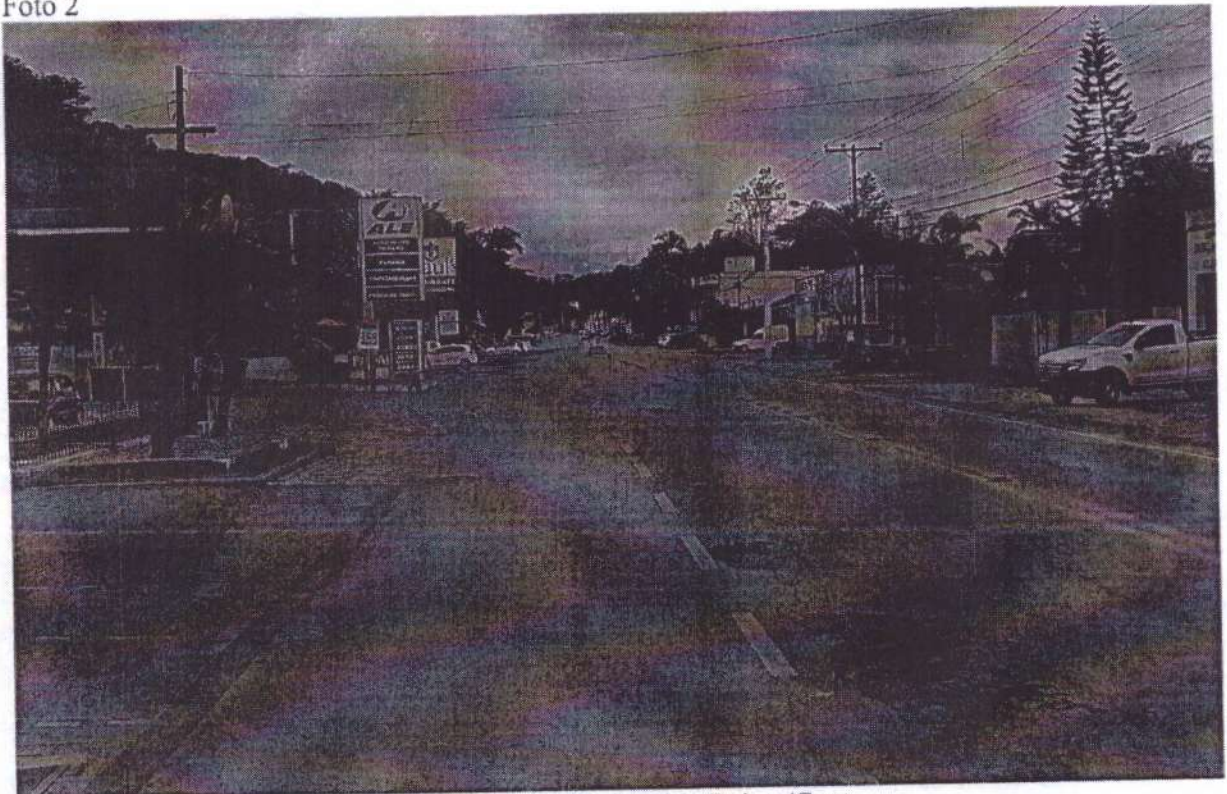
Rua Itajaí, n.º 535, Sentido Bairro/Centro