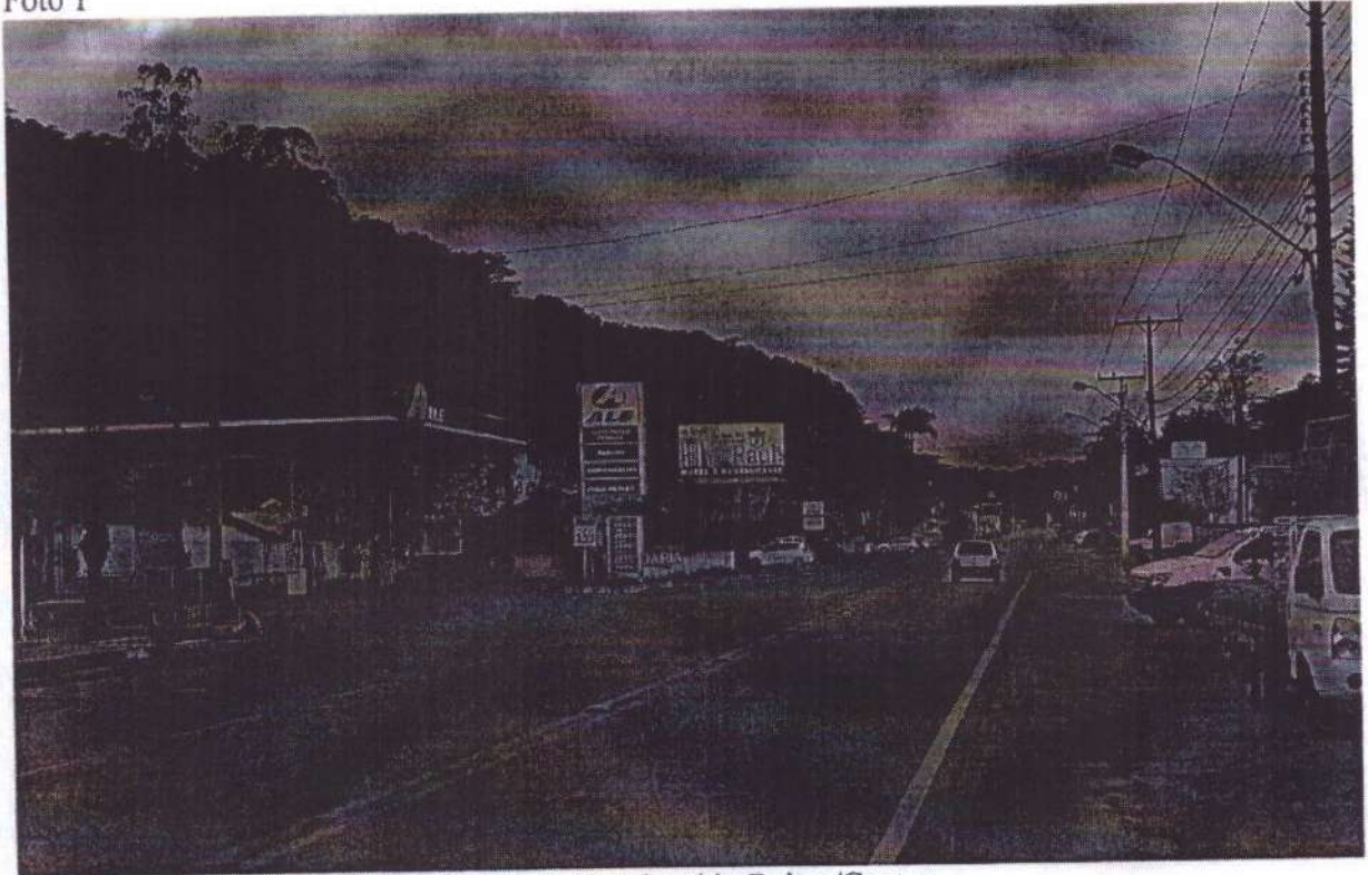
Rua Itajaí, n.º 535, Sentido Bairro/Centro