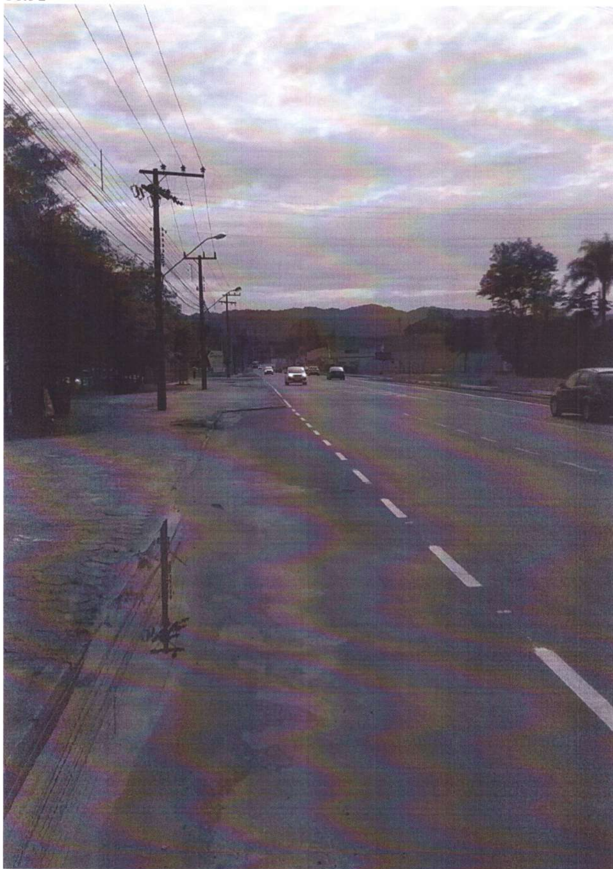
Rua Anfilóquio Nunes Pires, nº. 4242 Sentido Bairro/Centro