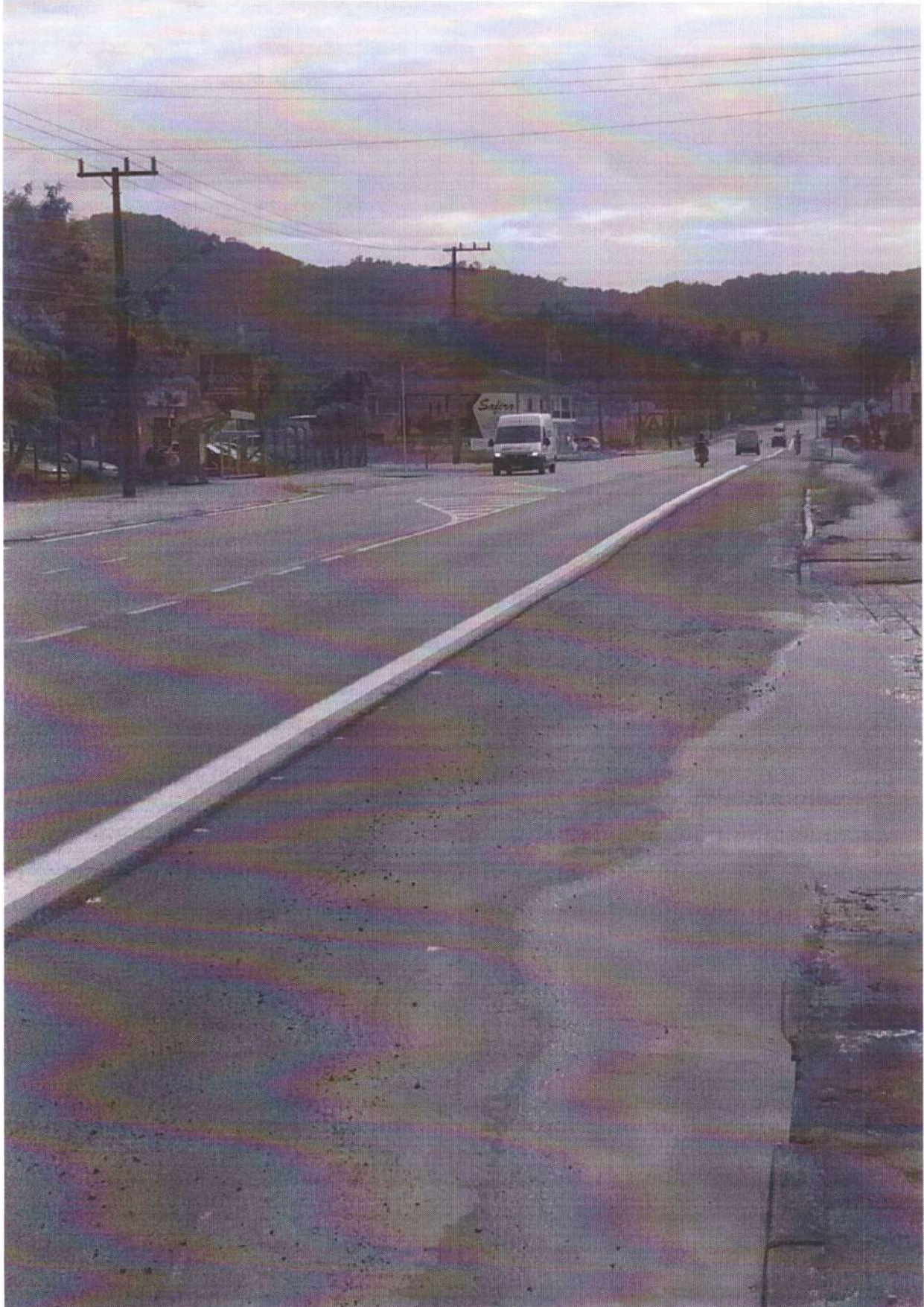
Rua Anfilóquio Nunes Pires, nº. 4242 Sentido Bairro/Centro