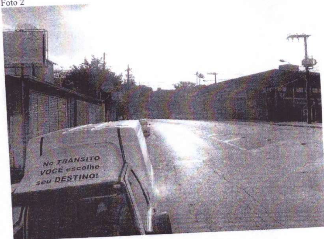
Rua Anfilóquio Nunes Pires n.º. 3726, Sentido Centro/Bairro