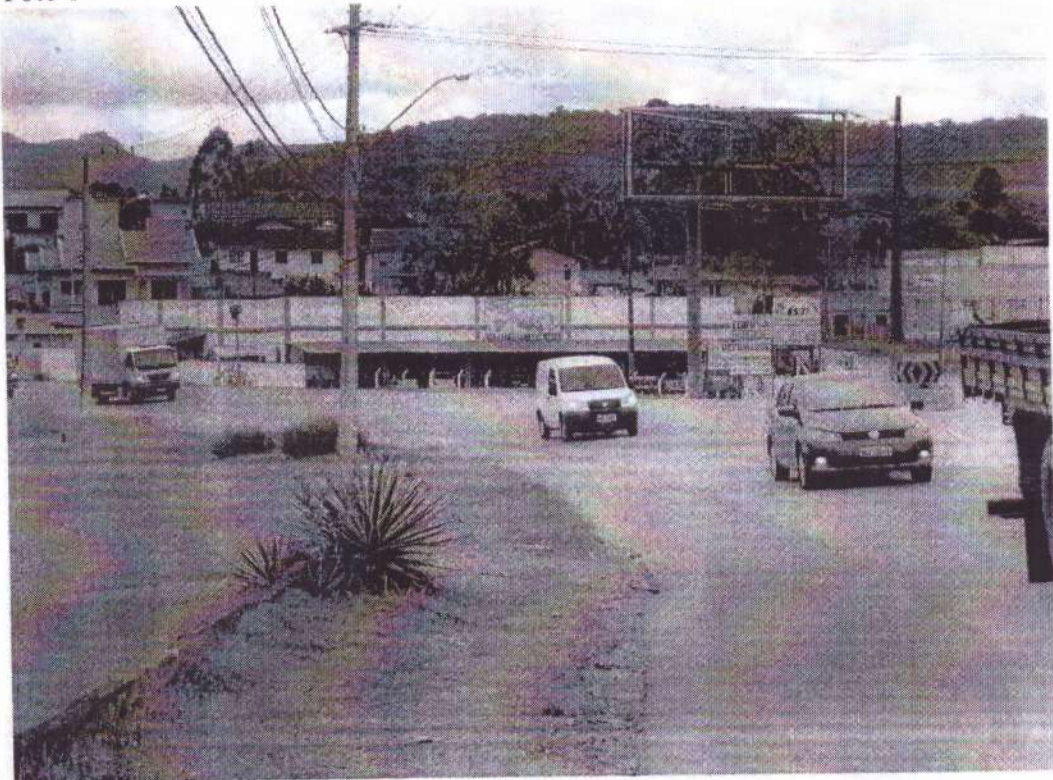
AV. Frei Godofredo, n° 2700