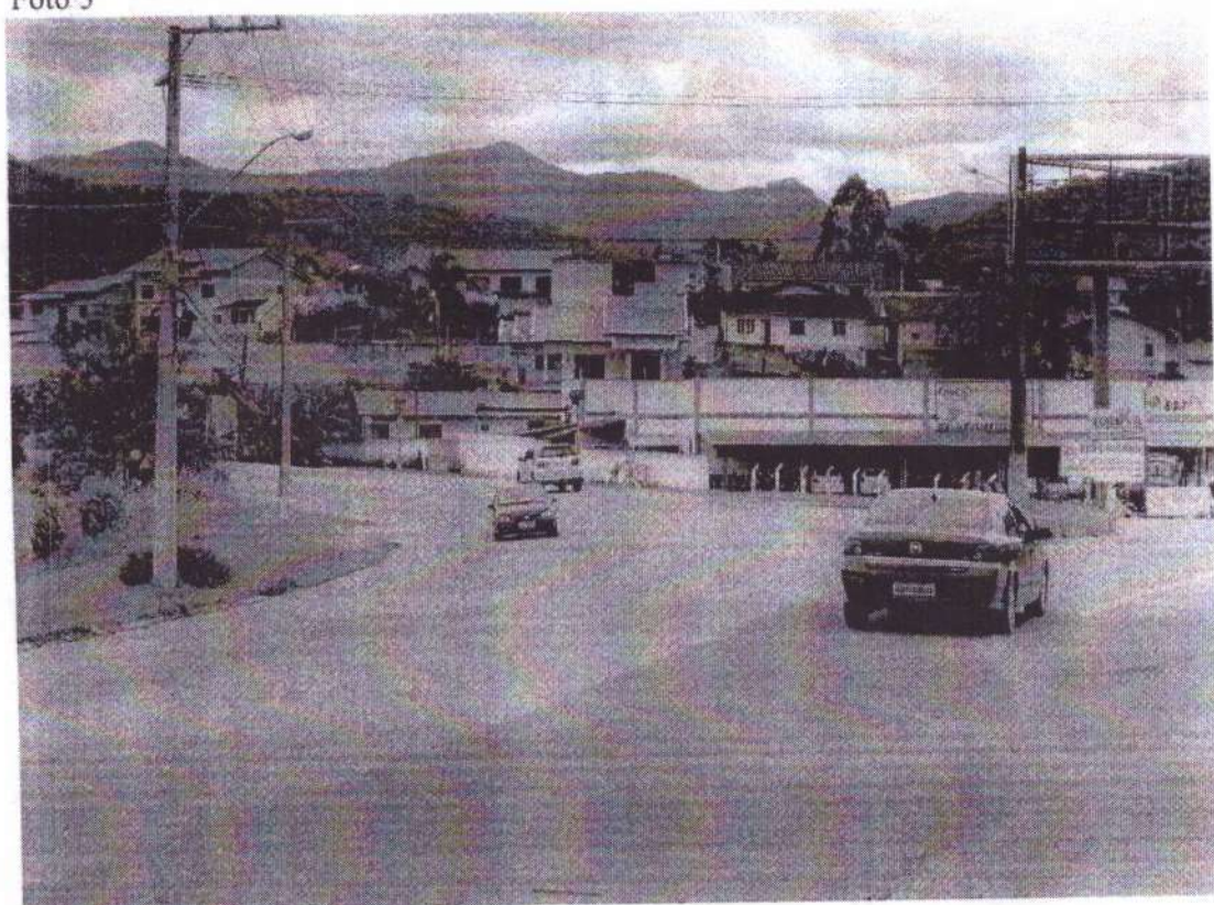
AV. Frei Godofredo, nº 2700