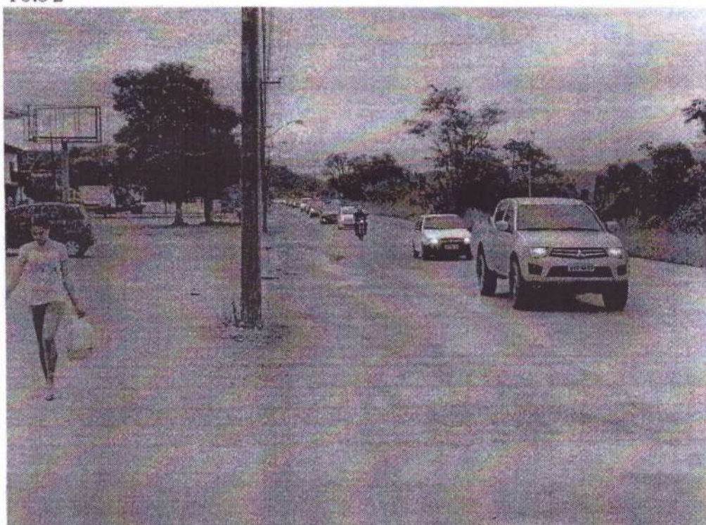
Rua Anfilóquio Nunes Pires, nº. 230 - Sentido Centro/Bairro