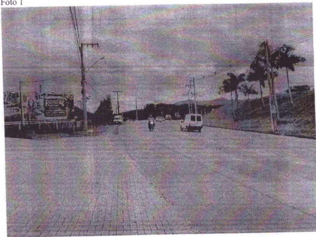
AV. Frei Godofredo, n°1650