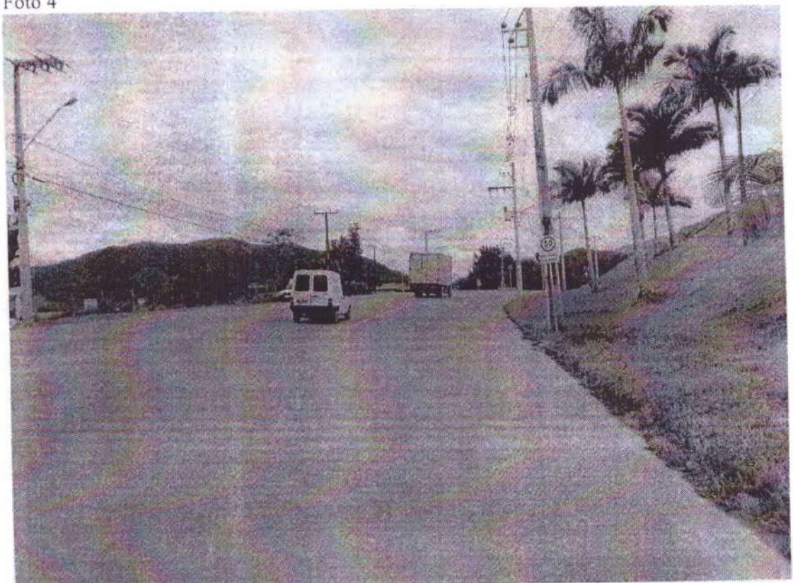
AV. Frei Godofredo, nº1650