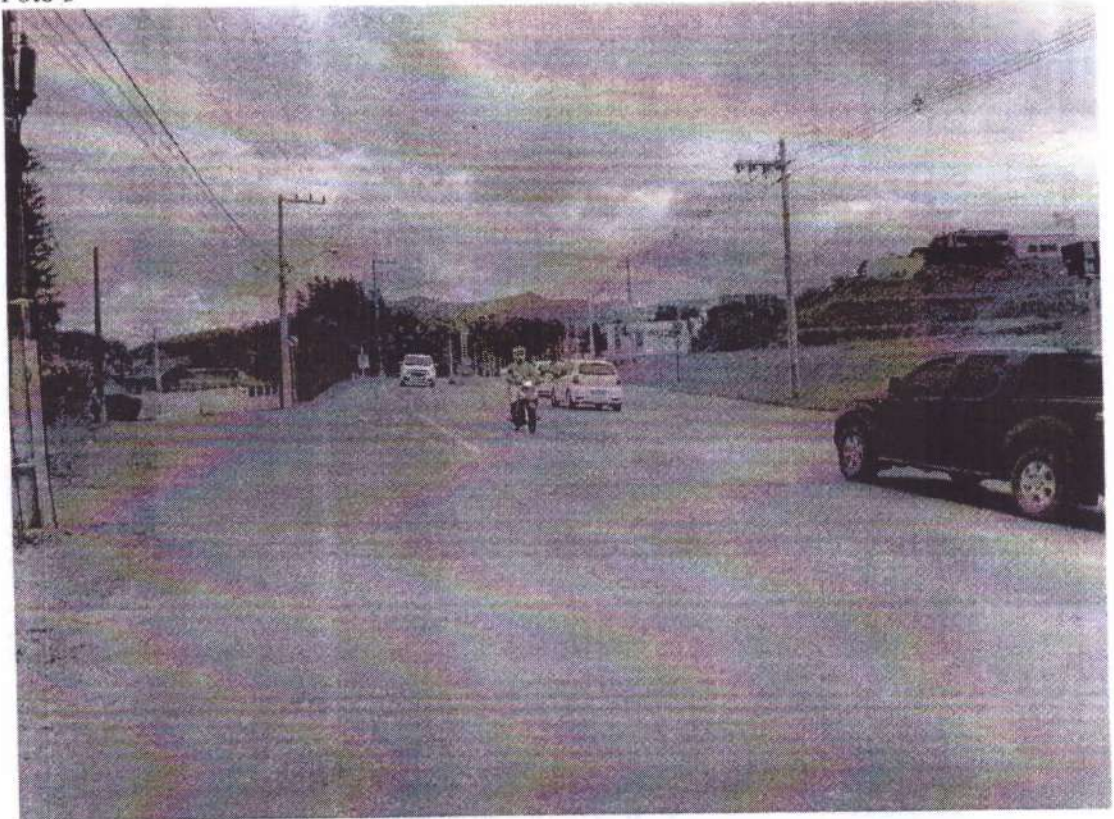
AV. Frei Godofredo, nº1650