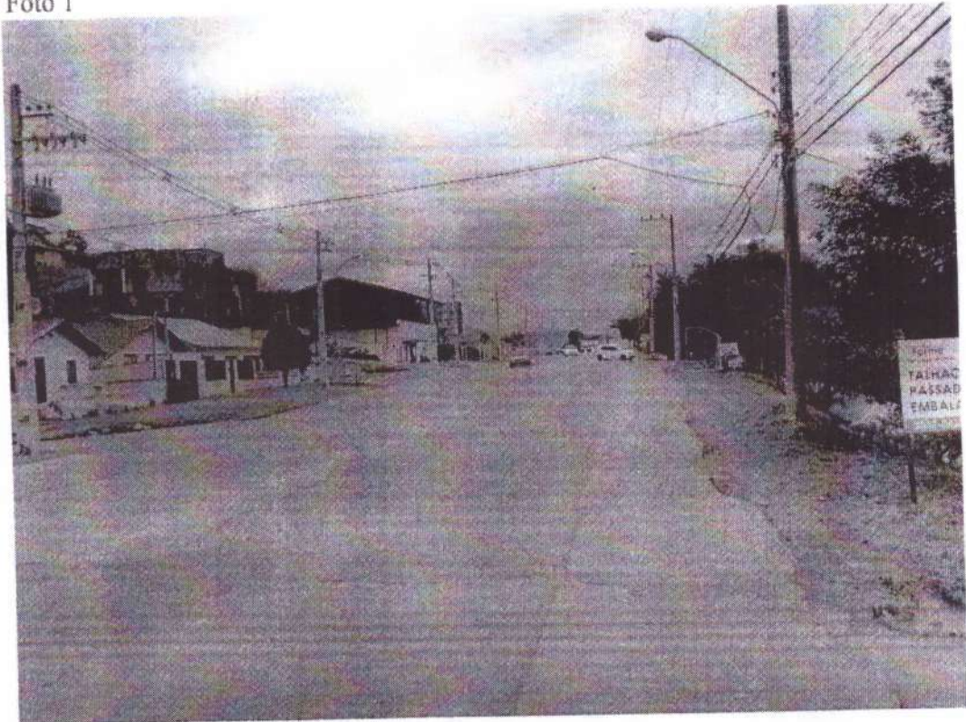
AV. Frei Godofredo, n°1649