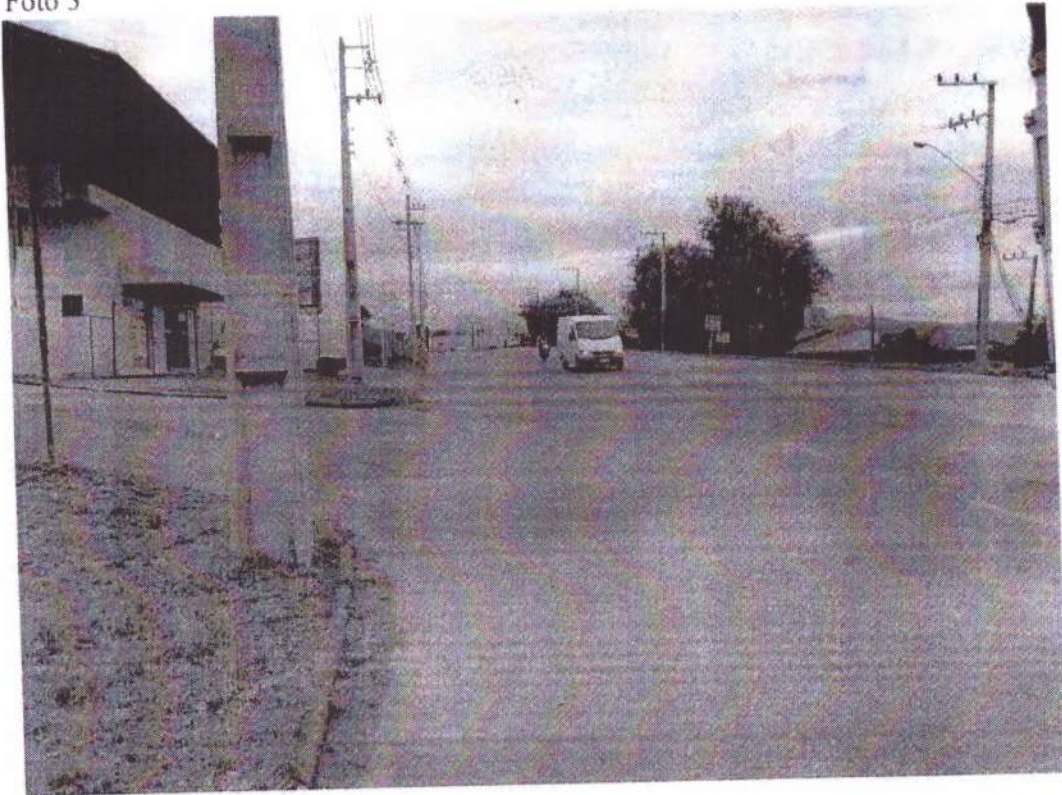
AV. Frei Godofredo, n°1649