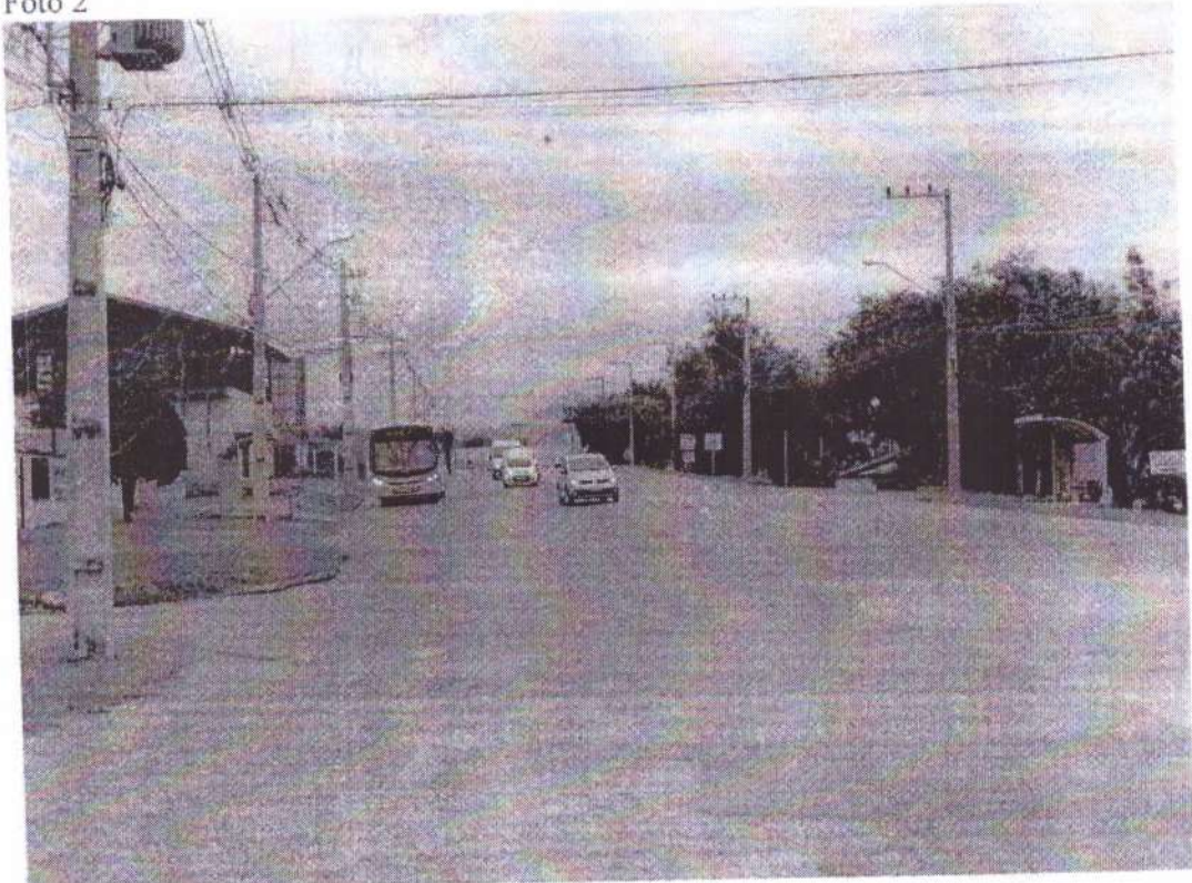
AV. Frei Godofredo, n°1649