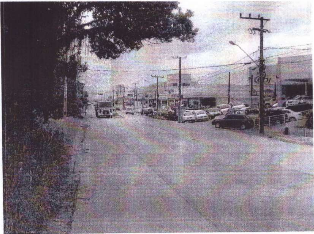
AV. Frei Godofredo, n°1081