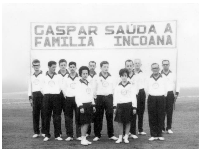
Colegas bancários em 1961