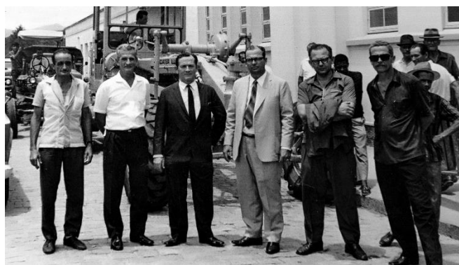
Sempre presente e participando dos grandes momentos da cidade