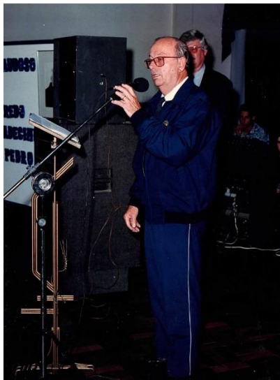
50 anos do Clube Musical São Pedro - 1998