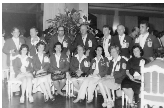
Convenção dos Lions Clube Gaspar – Joinville, 1975