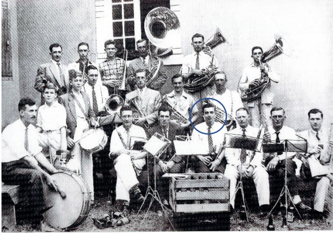
1ª Foto da banda: Tocata da Banda São Pedro – festa na capela do Barracão, 1949.

1948 a 2021 – músico do Clube Musical São Pedro – Clarinetista.