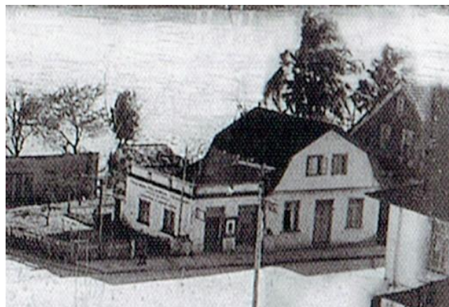
Sede da primeira Agência Bancária de Gaspar. Banco Indústria e Comércio de Sta. Catarina (INCO). Localizado em frente à escadaria da Matriz (1943).