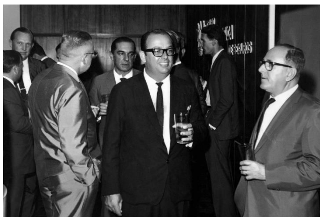
Presença eficiente junto as lideranças em prol das necessidades de Gaspar