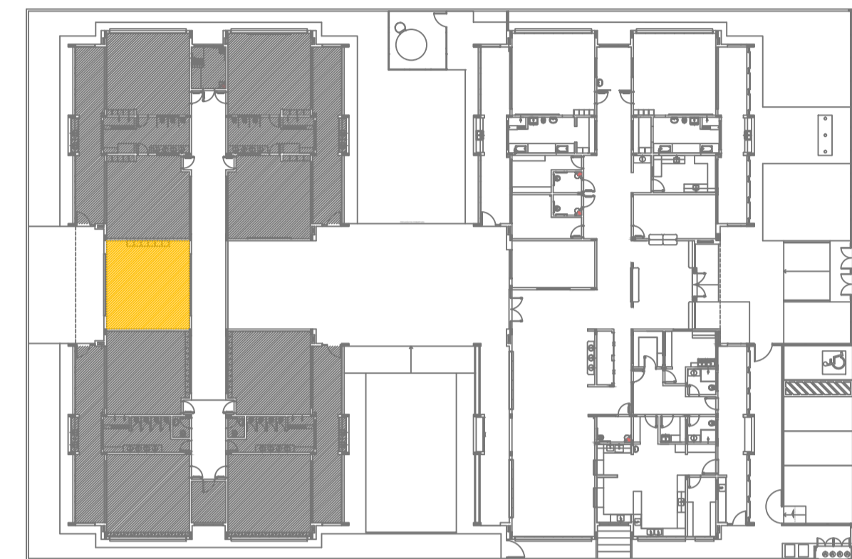
CROQUI DE REFERÊNCIA