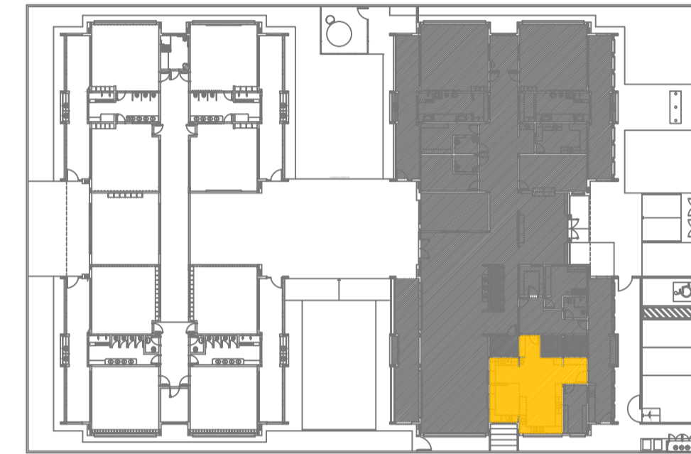
CROQUI DE REFERÊNCIA