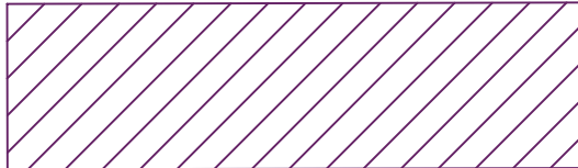
Cobertura metálica a ser removida e recolocada após tratamento de trincas